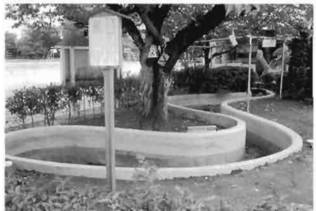
久下小学校のムサシトミヨ保護増殖池

特に、学校では、ムサシトミヨの保護活動が、地域住民を巻き込んで行われ、環境教育の絶好の場となっています。久下小学校を訪れた際、「トミヨ池」を見せていただきました。じっと目を凝らすと孵化したばかりのムサシトミヨの稚魚が、何匹も水草の間を泳ぎ回り、集まってきた子どもたちも優しいまなざしで観察しているのが印象的でした。