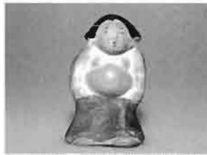
相撲取り 鴻巣市教育委員会蔵