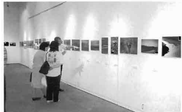
荒川を撮る会写真展