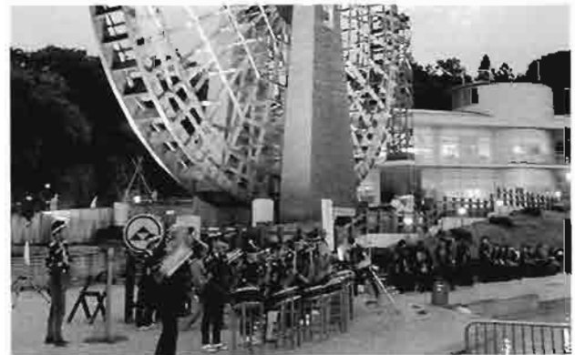
鳴子&太鼓フェスティバル