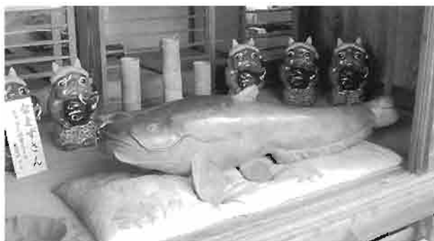
地震よけとして親しまれている「なまずさん」

日中は水底にひそむナマズが水面に現れると、天候がくずれるという言い伝えがもとになり、鯰は降雨祈願の神の使いとして祀られました。逆に、鯰の怒りをもって洪水が起きないようにと、水害よけの神様としている地方もあります。一方、ナマズは、地震の前にも水面に姿を現すという経験から得られた知識により、地震よけとしても信仰の対象となりました。また、鯰は、皮膚病を治す・無病息災を願うものとして、絵馬に描かれ奉納されています。