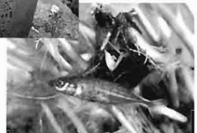
県の魚ムサシトミヨ

ムサシトミヨを見ることができるのは、保護活動を実際に行っている熊谷市内の佐谷田小学校・久下小学校・熊谷東中学校と、羽生市にあるさいたま水族館、騎西町にある県環境科学国際センターなどです。