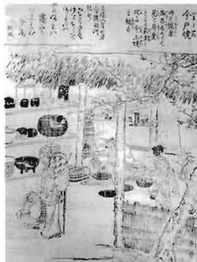
江戸名所図会 長谷川雪見・雪堤

今戸焼は、江戸時代中期以降、隅田川（荒川）の右岸現在の台東区今戸で焼かれた焼き物を言います。その始まりには不明な点が多いのですが、天正年間（1573-1591）に千葉氏（鎌倉・室町時代に下総守護）の家臣が住み着いて、荒川の氾濫原で採取された粘土「荒木田土」を用いて瓦や土器を焼いたのが始まりとの説があります。