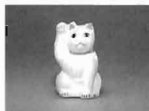
招き猫 鴻巣市教育委員会蔵