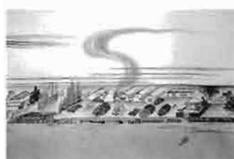
隅田川両岸一覽 鶴岡蘆水 当館蔵

かばら籠」では、在野業平の詠んだ「都鳥」とともに煙をたなびかせた瓦窯が描かれています。