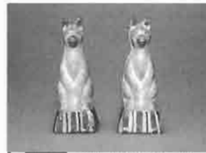
鉄砲狐 鴻巣市教育委員会蔵

び猫と暮らせるようになったという話があることから、今戸が招き猫の発祥の地との説があります。