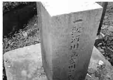
熊久橋の袂にある 起点の碑

足を伸ばして久下地区を散策すると、「東竹院と達磨石」「新久下橋」、昔の舟運の様子を忍ばせる「新川河岸周辺の屋敷森」、昭和22年のキャスリーン台風による荒川「決壊の跡」碑など、川や水に関する歴史上の見所がたくさんあります。