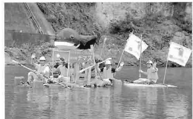
荒川イカダ下り2004参加の当館チーム