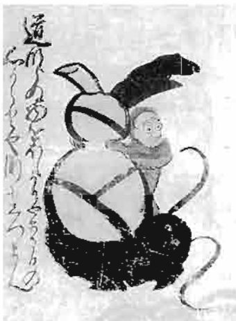
猿が瓢箪で押さえる鯨 〔大津絵〕瓢箪鯨 (町田市立博物館蔵) 「道ならぬ物をほしかりやまさるの心からとや測にしつまん」

関西を中心とする西日本では、如拙筆「瓢箪鯨」の流れから、瓢箪で鯨を押さえる図が、大津絵や震災後の書物に記され、祭礼の山車にも登場します。