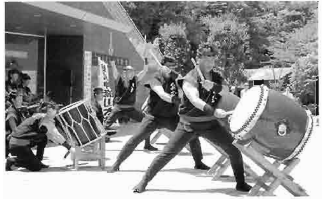
荒川劇場「川と太鼓」