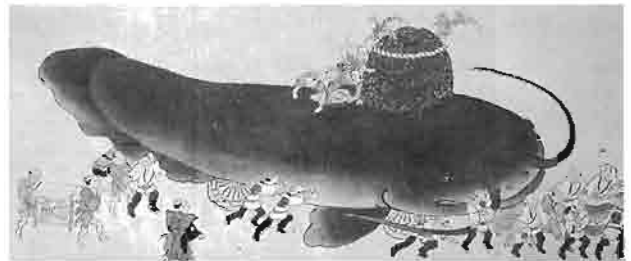
要石鯨の山車「神田明神祭礼図」(東京国立博物館蔵)

一方、関東を中心とする東日本では、鹿島神宮の大明神が要石で鯨を押さえるものとされ、祭礼の山車や震災報道の刷り物に描かれています。