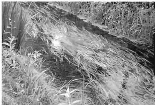
ムサシトミヨ生息地・元荒川の清流

また、絶滅寸前から現在に至るまで、元荒川周辺の人たちによる「熊谷市ムサシトミヨをまもる会」をはじめ、熊谷市の「ムサシトミヨ保全推進協議会」、県水産研究所、さいたま水族館など多くの関係者の努力や配慮によって支えられ奇跡的に生き残っているともいえます。