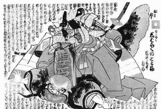
歌舞伎に登場する鯨坊主「〔鯨絵〕しばらくのそとね」

歌舞伎には、ガマカエルや虎・狐・鼠など、話の展開において重要な役割を演じる動物が登場します。歌舞伎に登場する鯨は、大きくわけて二形態あります。ひとつは、「傾城反魂香」などに登場する大津絵のなかの瓢箪鯨です。もうひとつは、「暫」に登場する鯨坊主です。どちらも主人公ではありませんが、彩りを添える名脇役として欠かせない存在です。