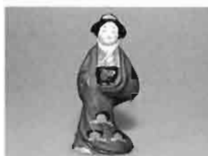
花魁 鴻巣市教育委員会蔵

招き猫は現在でも有名で、江戸時代の言い伝えに老婆が猫を飼えなくなり泣く泣く手放したところ、夢にその猫が出て来て「猫の人形を作り祈れば願いがかんう」というのでそのとおりにしたところ、再