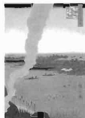
名所江戸百景 歌川広重 当館蔵

鶴岡蘆水が描いた「隅田川両岸一覽」では、隅田川沿いに多くの窯や燃料にした薪が描かれ窯業が盛んな様子がわかります。また、歌川広重の「名所江戸百景隅田河橋場の渡