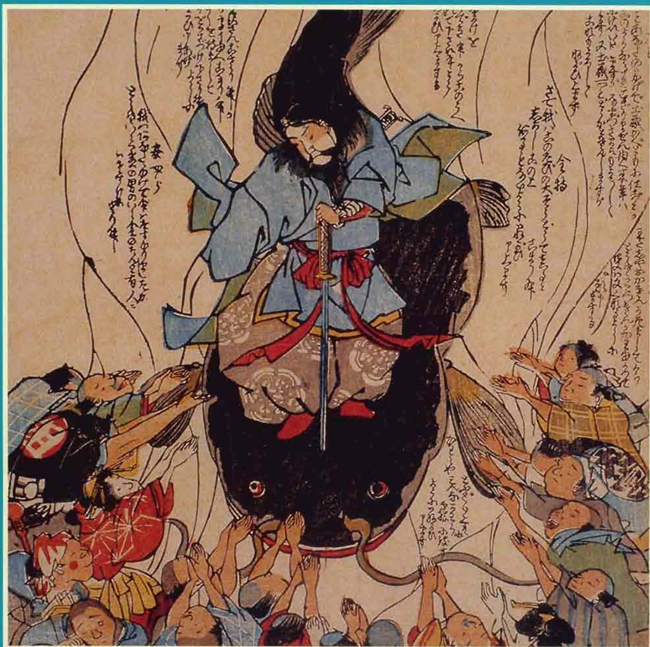
(絵巻) 地震鯰を押さえる鹿島大明神 (埼玉県立博物館蔵)