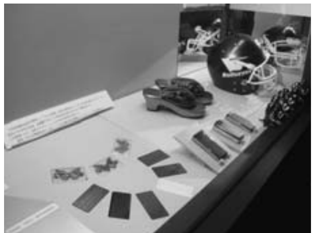
構造色を応用した製品