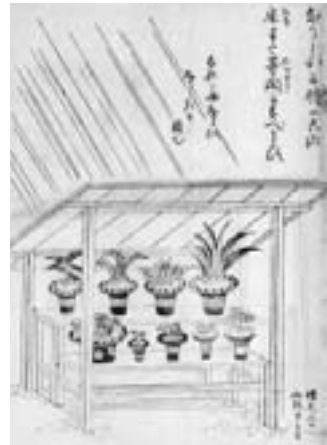
金生樹譜(千葉県立中央図書館蔵)

ガーデニングブームは今に始まったことではありません。江戸時代は現代以上に栽培が盛んでした。花を楽しむ植物のほか、変わった形や斑入りの葉をもつ個体が収集され、それらに名前をつけた銘鑑もつくられました。銘品に名を連ねる品種には高値がつきました。