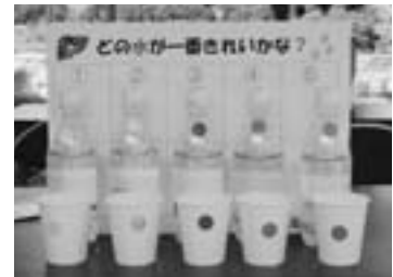
今年の実験セット

め、見た目で「一番キタナイ」と予想される参加者が大多数でしたが、残り4つの水は見た目だけではどれも同じように見え、参加者の皆様は四苦八苦しながら並び替えていらっしゃいました。