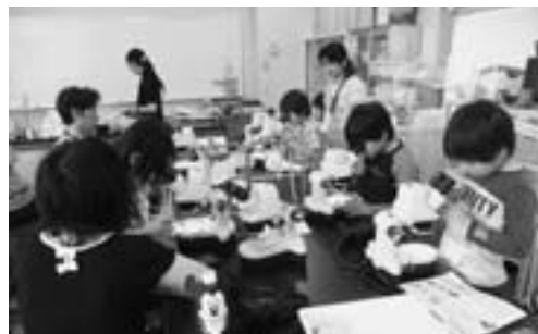
川砂の中の宝石さがし