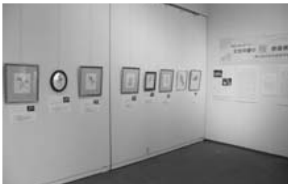
会場の様子（桜原画）