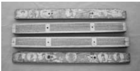
八千頌般若波羅蜜多經 (大正大学附属図書館蔵)

本資料(写真下)は、ネパール語で書かれた大乘仏教の経典で11世紀初めごろ作製されたと推定されています。上下の2枚は挟板で、彩色された仏画が描かれています。貝葉の本体は170葉からなり、その表裏に経文が書かれ、めくりながら使われました。