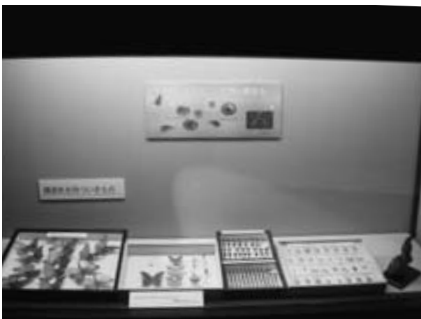
構造色を持つ生きもの1