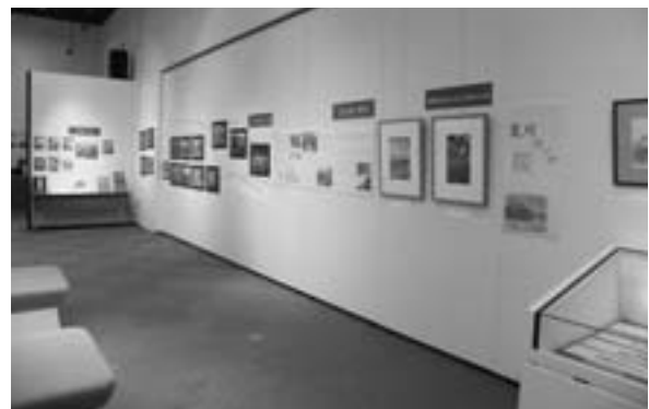
会場の様子（荒川沿いの桜）