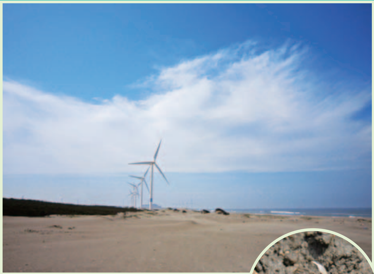
写真1 砂浜の風景（茨城県神栖市）